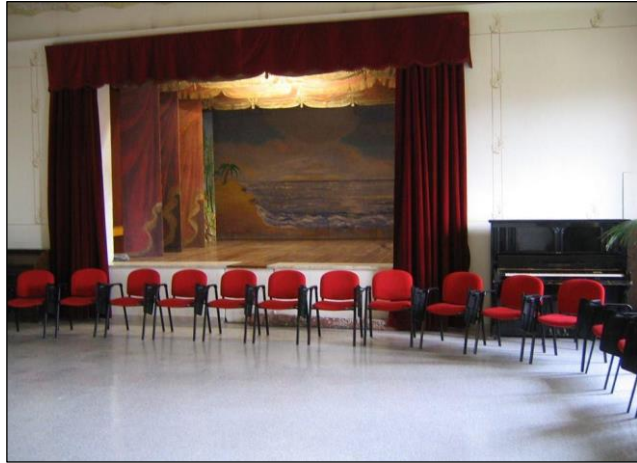
Fig. 3 Il Teatro della Scuola