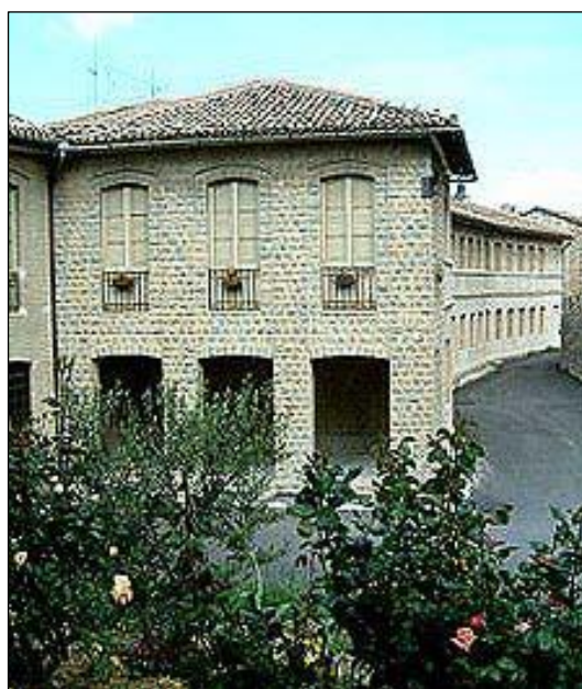
Fig. 1 Ingresso dell'Istituto "Bambin Gesù"

Con la riforma Gelmini (D.L. n.137 - 01.09.2008) dal 2008 sono attivi i due licei Linguistico e Scienze Umane. Nonostante le numerose difficoltà si cerca di portare avanti l'opera educativa nel campo giovanile, guidando gli alunni nella rielaborazione critica e personale dei contenuti culturali e spirituali.