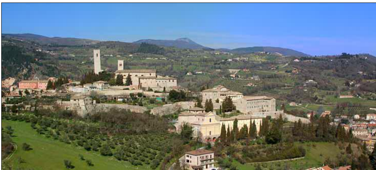
Fig. 2 Vista del castello al monte

L'orario d'ingresso è stato volutamente pensato affinché tutti i ragazzi provenienti da paesi vicini potessero raggiungere la scuola comodamente. L'istituto è facilmente raggiungibile sia dalla Stazione Ferroviaria che dal terminal dei bus. In un raggio di qualche centinaio di metri troviamo la Cattedrale e il Municipio. Sempre in questa area della città, ricca di storia e di arte, denominata "Castello", si trovano il Duomo Vecchio, costruito nel 944, riedificato nel 1061 e ampliato alla fine del sec. XII, con la facciata gotica dei primi del sec. XIV, il Chiostro del sec. XV e la Torre degli Smeducci della Scala di forma quadrata, alta circa 40 metri, risalente al sec. XIII che serviva per difesa, per prigione e per segnalazioni alle altre torri dei numerosi castelli del territorio comunale: Aliforni, Castel San Pietro, Isola, Colleluce, Carpignano, Serralta, Pitino, di cui restano imponenti ruderi.