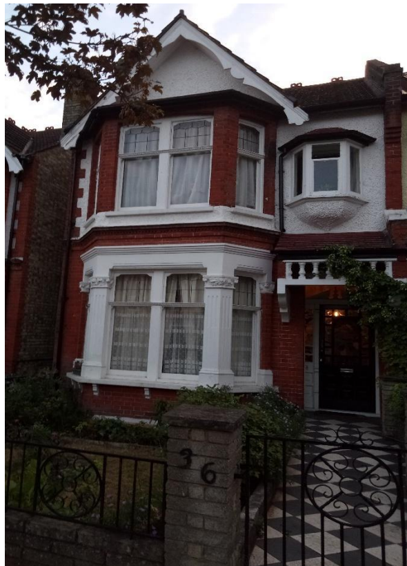
Fig. 4 Casa a Londra